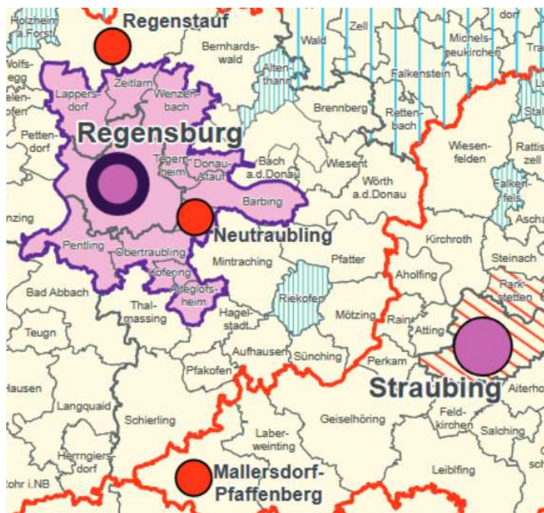
Auszug LEP Bayern: Anhang 2 Strukturkarte

(Z) Teilräume mit wirtschaftsstrukturellen oder sozioökonomischen Nachteilen sowie Teilräume, in denen eine nachteilige Entwicklung zu befürchten ist, werden unabhängig von der Festlegung als Verdichtungsraum oder ländlicher Raum als Teilräume mit besonderem Handlungsbedarf festgelegt.