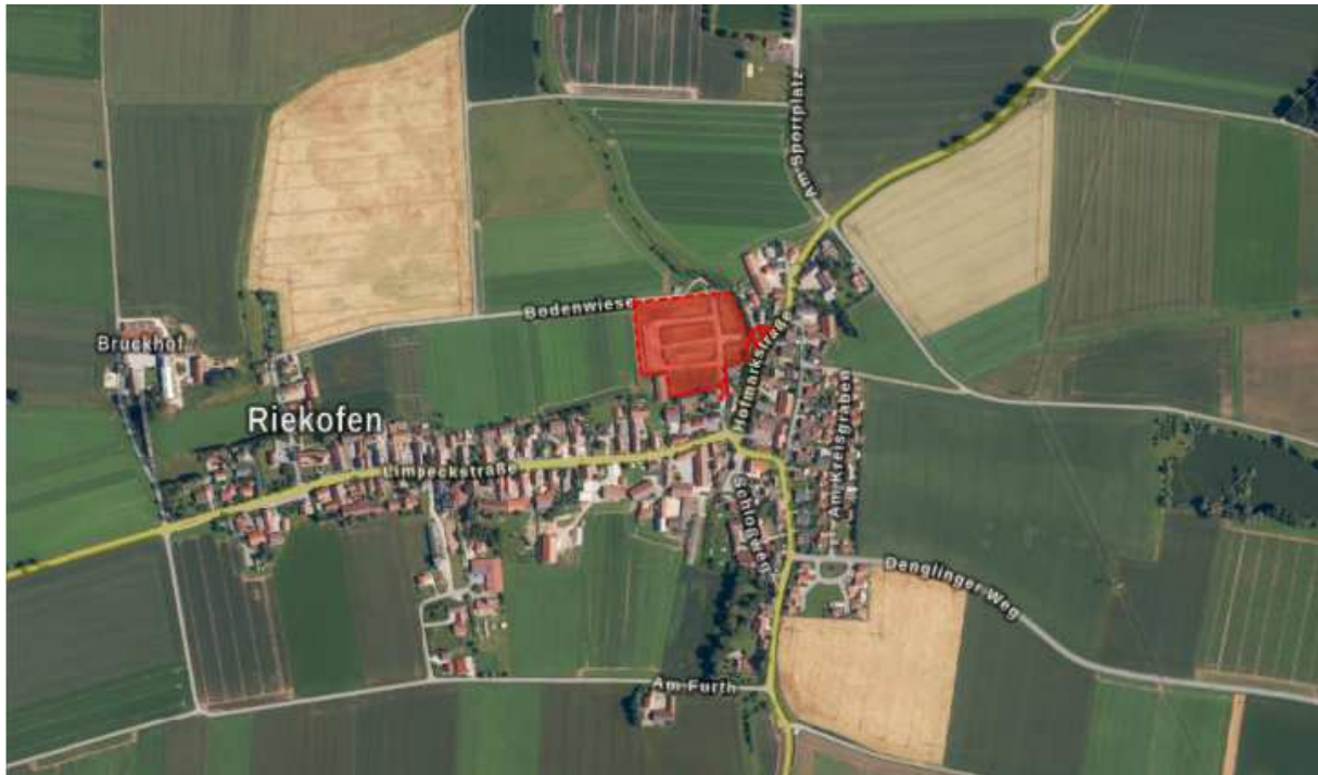
Luftbild mit Lage der Planungsflächen (rot) in Riekofen, o.M.

Die Planungsflächen sind über den Anwohnerweg „Am Gittinger Bach“ im Süden, der auf die Limpeckstraße/ R9 mündet, sowie den nördlichen Flurweg erschlossen.